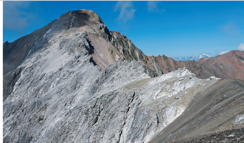
Der Grat zwischen Erzhornsattel und Gipfel.

hornsattel , 2744 m (3), ein Stück mit Lockerschutt deutlich mehr Mühe bereitet. Am Sattel weitet sich die Aussicht nach Süden. Wir folgen hier den roten Punkten nach rechts aufwärts und überschreiten die Kuppe P. 2866. Danach legen sich im Gratverlauf einige zerklüftete Kalkfelsen in den Weg, die jedoch überraschend leicht zu queren sind. Über Schrofen um ein Eck in eine kleine Hochmulde, aus welcher der ostseitige Schlusshang hinauf zum