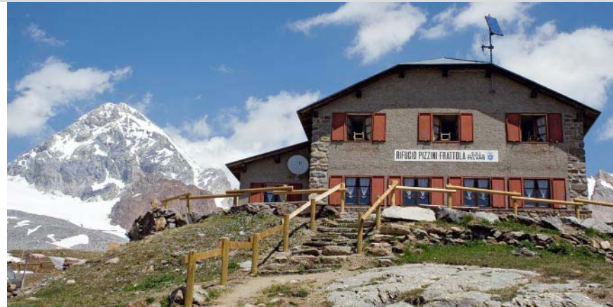
Rifugio Pizzini mit der Königsspitze im Hintergrund.

Das Rifugio Pizzini liegt malerisch eingebettet in einem Kessel am Fuße der majestätischen Pyramide des Gran Zebru (Königsspitze). Im Osten glitzert der Cevedale, im Süden der Pizzo Tesoro. Auch der riesige Forno-Gletscher, einer der größten des Alpenraums, scheint zum Greifen nahe. Wohl selten bietet eine so einfache und familientaugliche Tour ein solch prächtiges Panorama auf mächtige Gipfel, Grate und Gletscher.