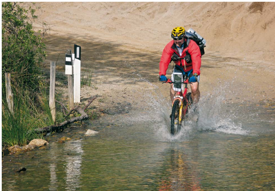
An der Furt beim Rückweg nach Piscinas. Bald ist das Ziel erreicht und der Strand lädt zum Badespaß.

Eine einfache, mittellange und sehr schöne Tour für jedermann. Auf kaum befahrener kleiner Straße, entlang der Küste und auf guter Piste durch ein altes Bergbaubgebiet trifft man zum Ab-