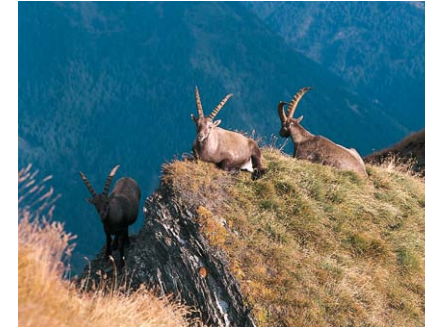
Steinböcke im Ködnitztal.

delsattel verlangt Trittsicherheit und quert den zerfurchten Westhang der Glatzschneid. Ein wackeliges Holzbrett hilft über eine Felsstelle und Seilsicherungen entschärfen abschüssige Schrofenfluchten, Rinnen und Gräben. Zum Medelsattel , 2676 m, ist noch ein Aufstieg notwendig, ehe die alpine Wanderung im Bergwiesengelände bei der Glorerhütte ausklingt, 1¼ – 1½ Std. vom Pfortwinkel. Zurück nach Heiligenblut geht's dann hinab durchs Glatz- und Leitertal.