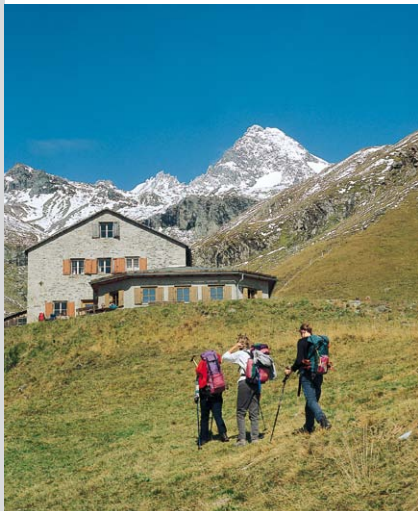
Die Lucknerhütte im Ködnitztal.

Stüdlhütte, 2802 m, DAV-Sekt. Oberland, erbaut 1868, Neubau 1996, geöffnet Mitte Juni – Anfang Oktober, 2 Betten, 106 Lager, Winterraum (offen), Materialseilbahn, Tel. 04876/8209, Tal 04876/22144.