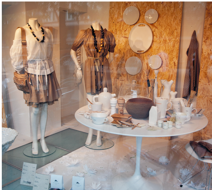
Ga er beslist eens kijken: de etalage van 'Norway Designs'

Industrigata 36, Majorstuen, purnorsk.no, metro: Majorstuen, ma.-wo., vr. 10-18, do. 10-19, za. 10-16 uur