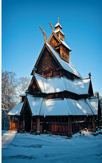
De staafkerk van Gol is op het terrein van het openluchtmuseum te bewonderen