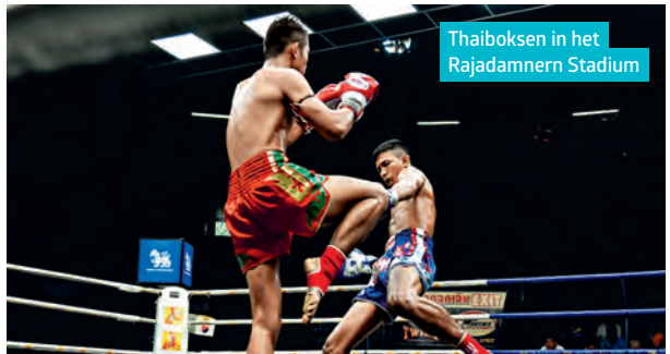
Thaiboksen in het Rajadamnern Stadium

| 66 Charoen Krung Rd | Het kaartje voor het Grand Palace (500 THB) is inclusief een theatervoorstelling | Ma.-vr. om 13.00, 14.30 en 16.00 u.