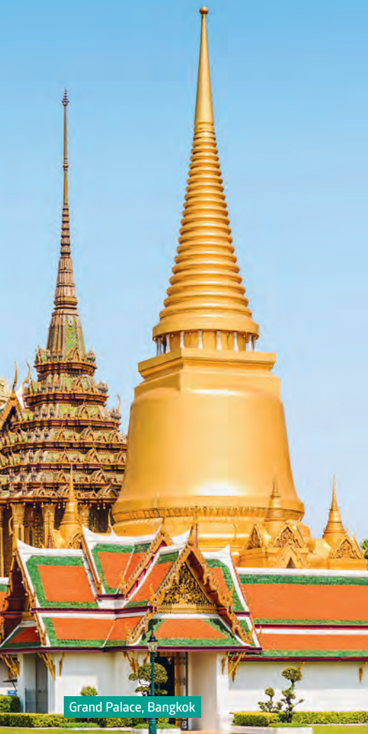
Grand Palace, Bangkok