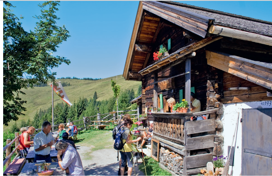
Einkehr auf der Schützingalm.