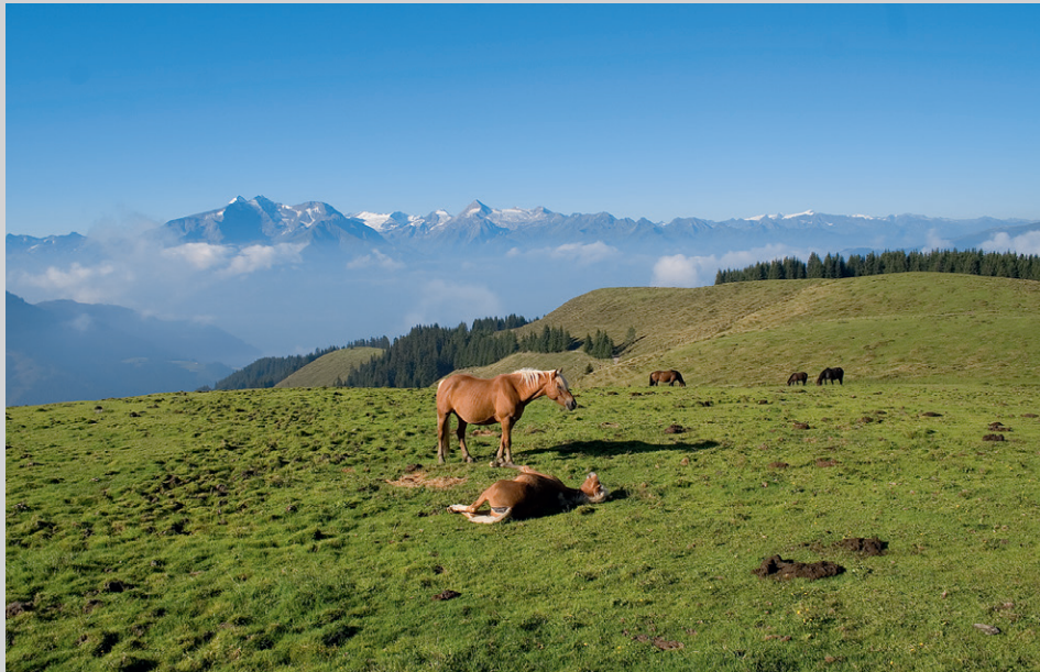
Weite Almflächen unter der Schwalbenwand mit Tauernblick.

Vom Wanderparkplatz beim Mitterberghof (1200 m) wandern wir Richtung Nordosten leicht ansteigend auf einer Forststraße (Weg Nr. 82, 83) bis zu einer Wegkreuzung mit Wegweiser auf 1283 m. Hier trennen sich die Wege 82 und 83. Wer nur eine kurze Tour zur Alm machen möchte oder mit dem Kinderwagen unterwegs ist, folgt der Forststraße Nr. 83 rechts hinauf zur Schützingalm (Abstiegsweg). Der Rest zweigt hier zunächst links, 50 m später rechts auf Weg 82 ab, folgt nun steiler auf der Westseite des Berghanges einem Waldsteig mit weiß-rot-weißer Markierung und quert dabei drei Forststraßen. Nach einiger Zeit lichtet sich der Wald und gibt erste Blicke gegen Westen auf die Schmittenhöhe frei. Kurz darauf kommt man auf eine Lichtung, die herrliche Blicke auf die Schwalbenwand, die Hohen Tauern und die Pinzgauer Grasberge frei gibt. Nach ca. 100 m durch