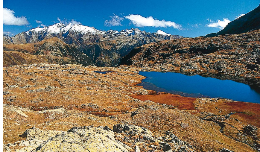
Ibón de la Solana mit Posets-Massiv im Hintergrund.