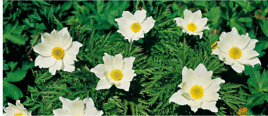
Blühende Bergwiesen: Anemonen.

Über dem Talkessel von Kolm-Saigurn erblickt man auf hoher Schneid im Osten eine Hütte, das Niedersachsenhaus. So exponiert seine Lage ist, so beachtlich ist auch die Szenerie, besonders bei Sonnenaufgang! Die Hütte ist sowohl von Kolm-Saigurn als auch von Sportgastein her zugänglich (siehe Tour 41).