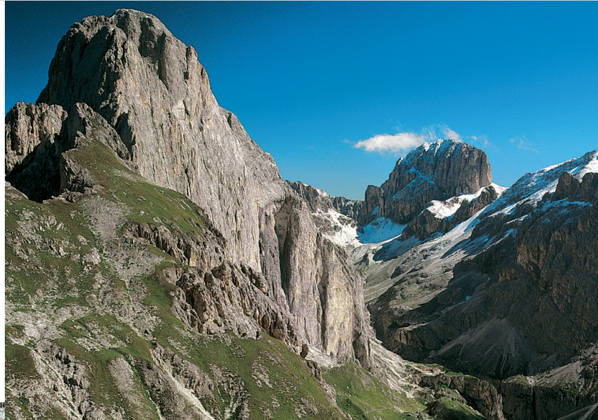
Das Vajolettal vom Tschagerjoch. Blick auf Rosengartenspitze und Kesselkogel.

Südwesten hinab zum Wiesenboden im Unteren Vajolonkessel , anschließend unter Rotwand und Fensterleturm eben nach Südosten zur Rotwandhütte , 2280 m. Auf Weg Nr. 549 (»Hirzelweg«), an den Abhängen der Punta di Masaré eben nach Süden und nach rechts (Westen) zum Christomanos-Denkmal (Bronzeadler, Verzweigung). Halb rechts (»Hirzelweg«, Weg Nr. 549) aufwärts, später nach rechts in die Westseite des Rosengartens und dort unter der imposanten Rotwand eben nach Norden, zuletzt hinauf zur Rosengartenhütte .