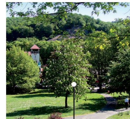
Kurpark in Schlungenbad.

i Grundlage des Staatsbades Schlungenbad sind warme Quellen. Der Gast kann sich in der Äskulaptherme und im Thermalfreibad wohlfühlen. Namensgeber für Schlungenbad ist die dort vorkommende Äskulapnatter.