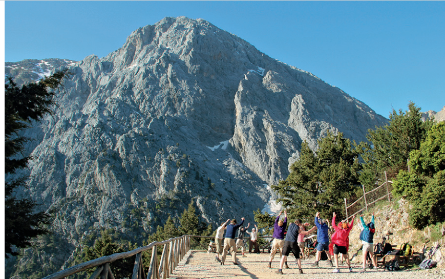
Gymnastique matinale à l'entrée de la gorge devant le Gingilos.

ges caillouteux. Afin de protéger l'environnement, il est interdit de quitter le chemin de randonnée principal. Beaucoup d'ombre dans la cour supérieure, mais la dernière demi-heure jusqu'à la mer se fait en plein soleil et, au cœur de l'été, sous une chaleur écrasante qui peut être extrêmement éprouvante – ne pas oublier de se protéger du soleil ! À mi-chemin, un poste de secours a été aménagé dans l'ancien village de Samaria ; le camping ainsi que la baignade sont rigoureusement interdits dans les gorges. Emporter toutefois ce qu'il faut pour profiter de la belle plage de galets à Agia Roumeli.