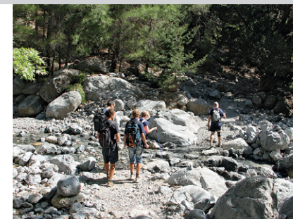
Dans le cours supérieur rocailleux des gorges.

la gorge et nous accompagne également en permanence dans la première partie de la descente. Après avoir acheté un billet à la caisse (contrôle à la sortie des gorges), on descend sur le chemin en escalier et flanqué d'un garde-corps. La descente en zigzags est rapide et de nombreux passages sont protégés des chutes de pierres par des filets qui arrivent au moins à retenir les petits morceaux de rochers. Le sentier s'étire au coeur d'une somptueuse forêt d'essences mixtes composée de cyprès de montagne, de chênes kermès et, dans le cours inférieur, de pins de Calabre ; toutes les quelques centaines de mètres, des points d'eau ont été aménagés pour pouvoir lutter contre le feu si besoin est. Le cyclamen de Crète ( Cyclamen creticum ) foisonne ici dans les endroits ombragés et on trouve également de la crapaudine de Syrie ( Sideritis syriaca ) qui, une fois séchée, est vendue sous forme de thé des montagnes crétoises également en Europe centrale.