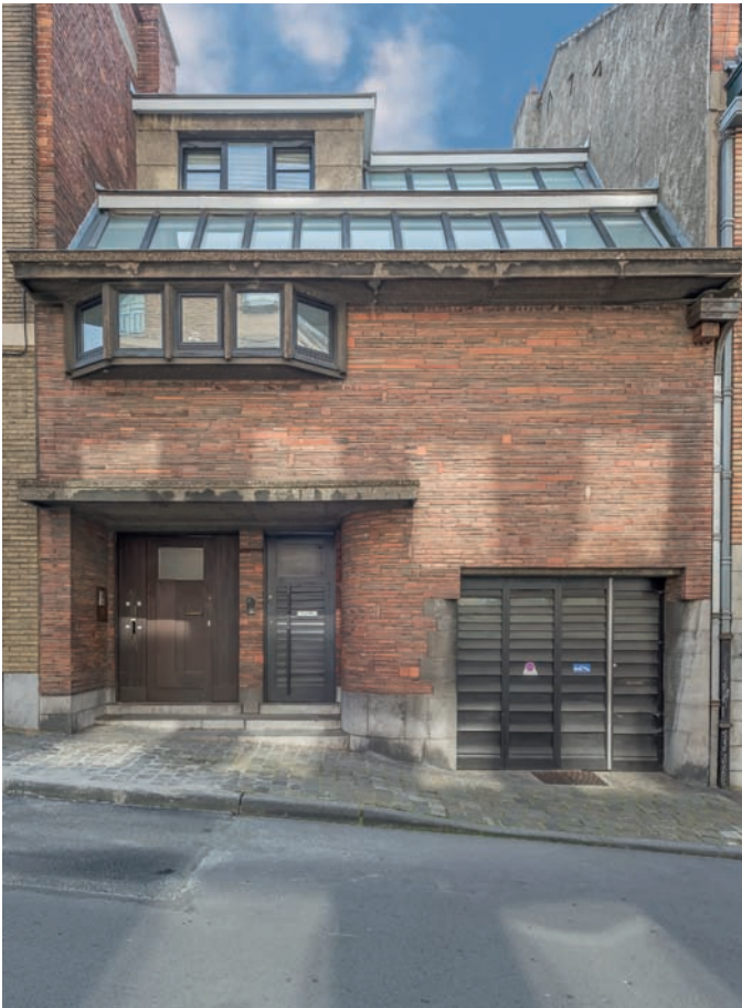
◀ Woningen, Paul Spaakstraat 2-4, arch. F. Bodson

Aan de oneven kant van de Kluisstraat bevindt zich het CIVA, het Centre international pour la Ville, l'Architecture et le Paysage. Aan de overzijde, achter een groep moderne gebouwen die opgetrokken zijn na de Tweede Wereldoorlog op de plek waar een V1 viel in 1944 (58-70), ziet u een reeks appartementsgebouwen uit het interbellum: op nr. 52 een art-decohuis (arch. Adolphe Puissant, 1923) met de originele baksteendesigns en gestileerde uilen onder de ramen op de eerste verdieping; op nr. 50 een appartementsgebouw in art deco met een opvallende ingang (arch. Jos Mouton, 1925); op nr. 48 een modernistisch appartementsgebouw, gebouwd voor de vastgoedontwikkelaar Les Pavillons français (arch. Marcel Peeters, 1938); op nr. 46 een appartementsgebouw dat lijkt op een pakketboot met een indrukwekkende volumetrie (arch. Lucien De Vestel, 1936).