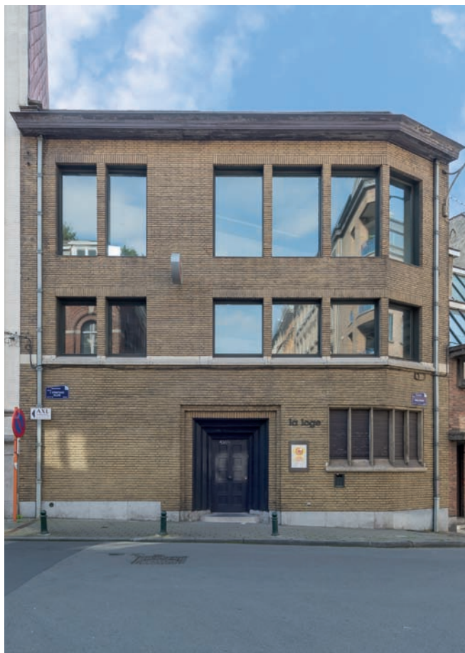
◀ Voormalige vrijmetselaarsloge

Vandaag biedt het onderdak aan La Loge, een Brusselse ruimte gewijd aan hedendaagse kunst, architectuur en theorie. De volumes en decoratie van 1935 bleven bewaard, waaronder de originele tempel, een grote, witgeschilderde parallelepipedum. Aan de buitenkant trekken enkel de opvallende volumetrie van het gebouw en zijn portiek in donker hout de aandacht van het nietsvermoedende publiek. De ingang, gevat in de gevel, vormde het startpunt van een symbolische tocht vanuit de schaduw naar het licht. Een van de eerste modernistische architecten, Fernand Bodson (1877-1966), weigerde elke referentie aan vroegere stijlen, zonder evenwel extreem gestripte gebouwen op te trekken. Als geëngageerd filantroop, die ook aan de basis lag van verschillende kranten, nam hij deel aan de discussies over de heropbouw van België na de Grote Oorlog. Hij bouwde sociale woningen en ontwikkelde prefabricatiemethodes. Eind jaren twintig nam hij afstand van het modernisme, geërgerd door het radicalisme ervan. Uiteindelijk verhuisde hij naar de Verenigde Staten. Deze vrijwillige ballingschap verklaart ook waarom hij niet erg bekend is.