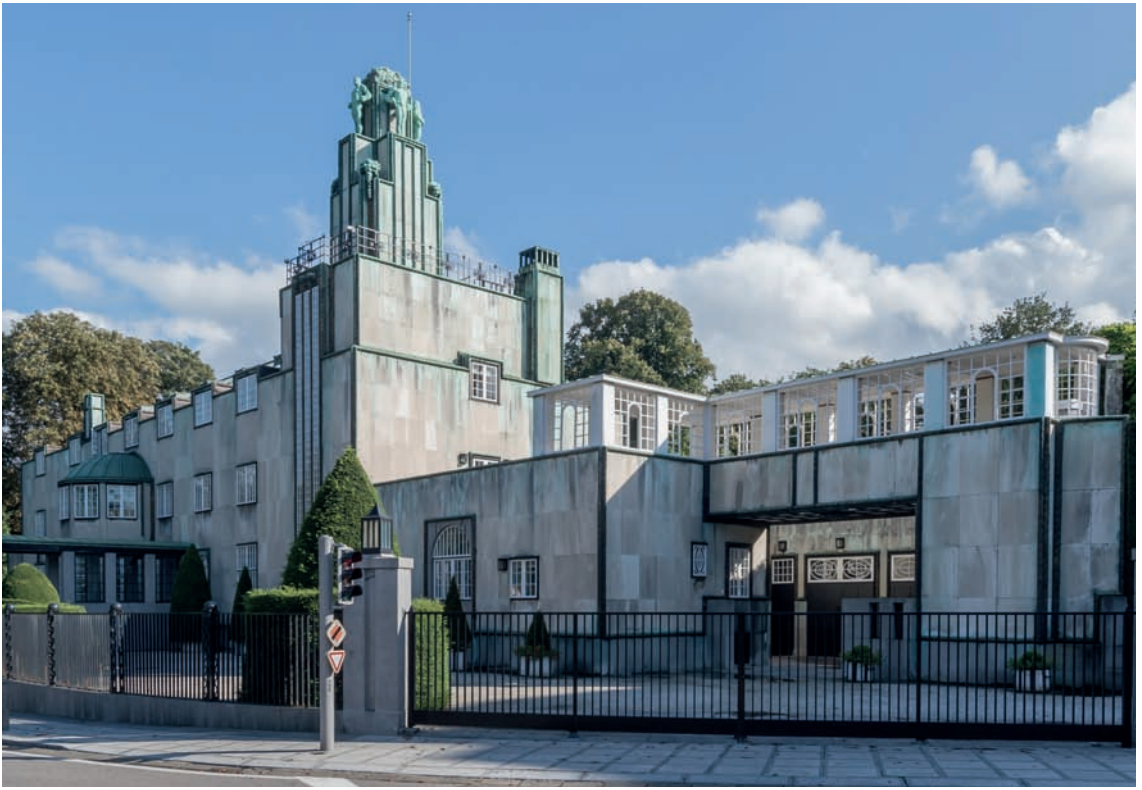
▲ Het Stocletpaleis, Tervurenlaan 279-281, Sint-Pieters-Woluwe, arch. J. Hoffmann, 1905-1911

tot 1930, adopteerden de Belgische architecten de principes van expressionistische effecten, die bereikt werden door stenen te schikken in geometrische en reliëfpatronen. Van De Stijl (1917-1928), gegroepeerd rond de schilder Piet Mondriaan, onthielden ze de structuren die gevormd werden door eenvoudige rechthoekige bakstenen of betonblokken die geen enkele decoratie bezaten, behalve (primaire) kleuraccenten. De combinatie van volumes voegde diepte en reliëf toe. Net als deze twee bewegingen geloofden sommige Belgische architecten dat architectuur de wereld kon veranderen, als zelfs de eenvoudigste en meest economische programma's, zoals appartementen voor arbeiders, een zekere waardigheid uitstraalden. Ook de