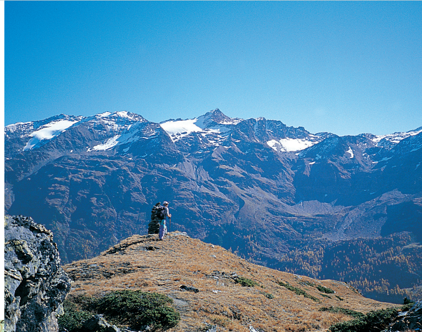
Auf dem Pederköpfl, Blick nach Osten, mit der Zufrittspitze als höchster Gipfel.

Varianten: 1) Von der Peder Alm kann man auch auf Weg 20 weiter talwärts Richtung Borromeohütte absteigen und dann auf Weg 6 zum Zufrittthaus gelangen. 1.30 Std. 2) Eine weitere Möglichkeit ist, zur Enzianhütte abzusteigen und von dort auf dem alten Militärsteig (»Multi-steig«) in schöner Wanderung zum Zufrittthaus zurück zu gelangen. 1.45 Std.