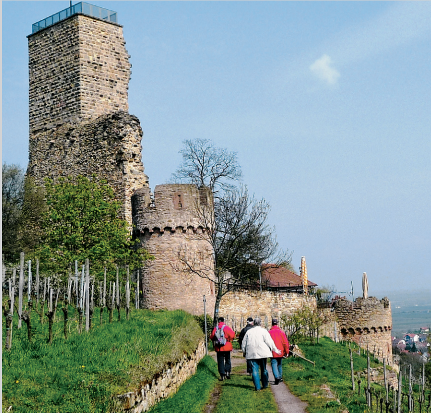
An der Wachtenburg.

Vom Hauptportal des Bahnhofs in Bad Dürkheim (132 m) laufen wir zum Wurstmarktbrunnen und zum Denkmal für Gefallene vor. Nach links kommen wir durch die Mannheimer Straße sogleich in die Fußgängerzone, die einen angenehmen Aufenthalt bietet. Dadurch sollten wir uns aber von der Wanderung nicht abhalten lassen. Am Römerplatz wenden wir uns nach links (Süden). Bald sind wir Lärm und Abgasen der viel befahrenen Weinstraße ausgesetzt, bis wir an der mächtigen Kastanie und dem Erfrischung spendenden Brunnen des Amtsplatzes nach rechts ausweichen können. Wir folgen nun der Wegweisung »Flaggenturm« wenige Meter durch die Seebacher Straße, dann der Straße Schenkenböhl mit ihren schönen Häusern