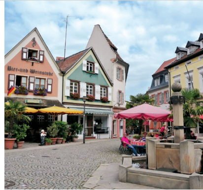
Zentrum Bad Dürkheim.

Unterkunft: Bad Dürkheim siehe WS 1. – Wachenheim (Vorwahl 06322): Kat. III: HR Goldbächel (www.goldbaechel.de, Tel. 940 50), P Weingut Zimmermann (www.rieslinghof.com, Tel. 98 98 92-0), P Altstadt-Residenz (www.Altstadt-Resi-