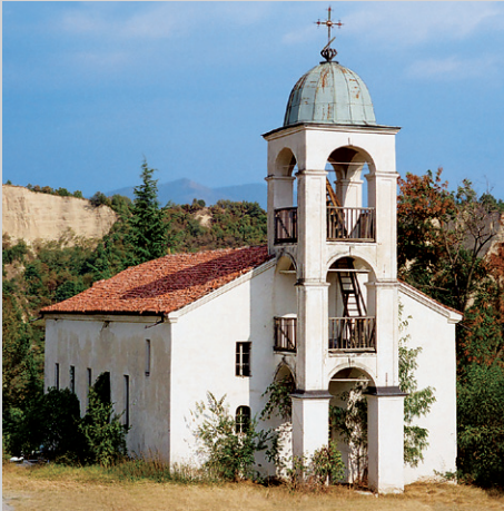
St.-Cyrill- und Methodius-Kirche.

linken Hang des Tals in die Höhe von rund 700 m auf einen faszinierenden Aussichtskamm auf. Das gesamte Panorama der Melniker Pyramiden hält von hier aus gut einem Vergleich mit dem türkischen Kappadokia oder manchen nordamerikanischen Cañons stand. Im Norden sehen wir schon das eigentliche Pirin-Gebirge. Nach einer Pause steigen wir zum nicht weit entfernten Rožen-Kloster (Roženski Manastir) ab, dessen einzigartige geistliche Atmosphäre vollendet mit der umgebenden Bergnatur harmonisiert.