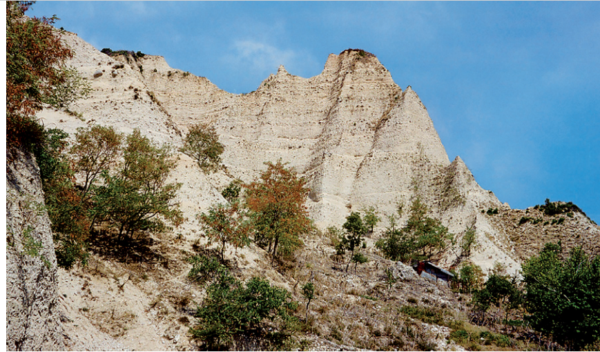
Breit ausladende Erdpyramide im Tal des Flusses Roženska Reka.

2. Verbindung mit Tour 2; insgesamt etwa 6.00 Std.