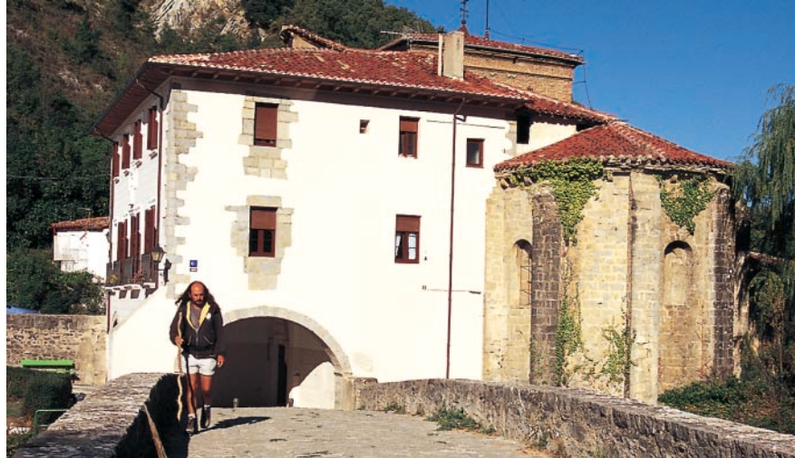
Sur le pont médiéval de Trinidad de Arre.

Remarques : Pendant les fêtes de Sanfermines (6–14 juillet), mieux vaut éviter la ville bondée en raison de la fiesta d'autant plus qu'il est quasiment impossible de se loger (prendre le Camino aragonés).