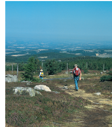
Abstieg vom Truc de Fortunio.

Für den nächsten Streckenabschnitt wandern wir auf dem asphaltierten Weg wieder retour, bis links