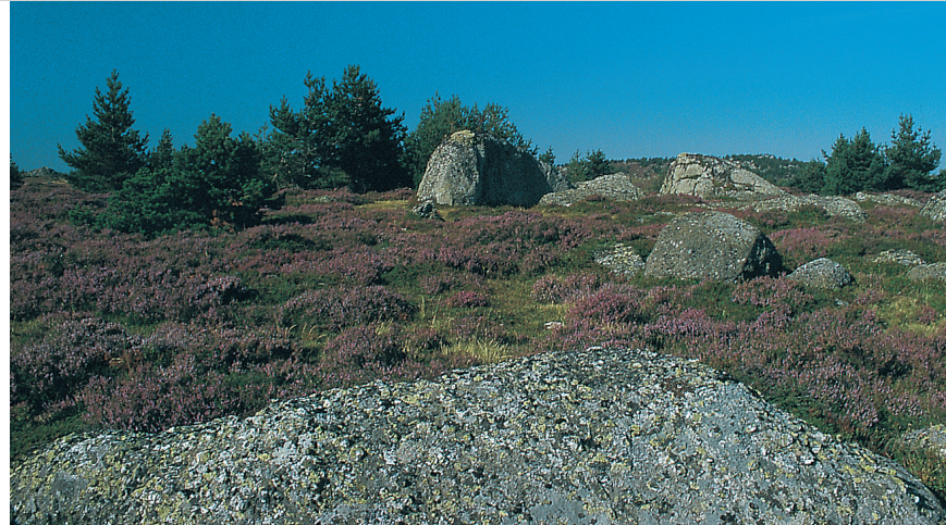
Felsen setzen Akzente zwischen Erika und gedrungenen Nadelbäumen.

Der Parkplatz liegt direkt an der Staumauer des Lac de Charpal (1) , die wir zu Beginn unserer Tour überqueren. Es geht zunächst geradeaus auf einem geschotterten Weg in den Wald hinein und am Maison Forestière (Forst-