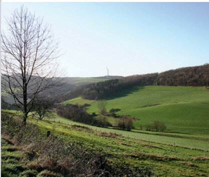
Im Balkhauser Tal.

Man glaubt nicht, im Ruhrgebiet zu sein auf dieser das Auge verwöhnenden Kurzwanderung. Ein kleines Seitental, wie es auch in den Alpen sein könnte, ermuntert uns, es an seinen Hängen zu umwandern. Etliche Höhenmeter und die Felsartisten im Klettergarten Isenberg verstärken diesen Eindruck.