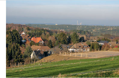
Fernsicht vom Kressenberg über das Ruhrgebiet.

Sträßchens können wir einen Abstecher zum Klettergarten Isenberg machen und den Felsenturnern eine Weile zuschauen. Danach senkt sich bald das Sträßchen Richtung Nierenhof. Nach einem kurzen Waldstück macht unsere kleine Straße eine scharfe Rechtskurve, und wir erreichen die ersten Häuser. Kurz auf der Straße nach rechts weiter, dann links in den Balkhauser Weg, bis nach wenigen Metern rechts eine Treppe an der Reithalle hinunter zur großen Kohlenstraße (L 439) und nach Nierenhof leitet. Dort rechts an der Straße entlang ein kurzes Stück Richtung Kupferdreh und nach wenigen Metern wieder rechts hinauf zur Kirche. Gleich hinter der Kirche links ansteigend, jetzt immer der Markierung Raute 7 folgend, Richtung Waldrand. Ein letzter Blick noch einmal ins Balkhauser Tal, dann nimmt uns ein lauschiger Mischwald aus Tannen, Eichen und Birken auf. Der Weg ist schmal, kurvig und unwegsam. Bei Nässe sind die Wurzeln rutschig und der Boden bisweilen tief aufgeweicht und matschig. Oben auf dem Kamm des Kressenberges angekommen, wird aus dem Pfad aber wieder ein breiter Weg, auf dem wir rechts durch einen von Lichtungen durchsetzten, herrlichen Buchenwald wandern. An einer Schranke des Forstweges nehmen wir nun die Fahrstraße nach rechts und am Wasserturm vorbei. Ein großartiger Fernblick eröffnet sich uns über das