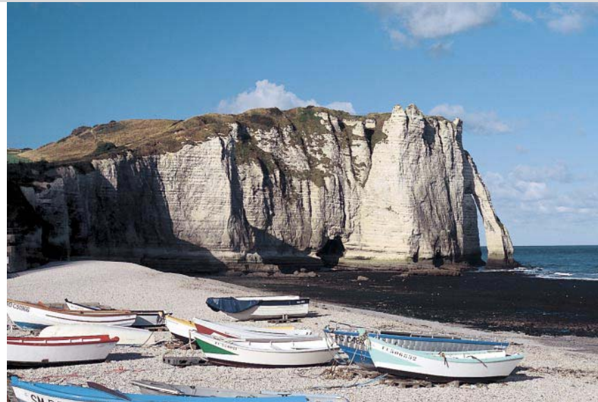
Ein beliebtes Motiv bei Monet: die Falaises d'Aval von Étretat.

delfreiheit erforderlich. Einkehr: Unterwegs keine; zahlreiche Restaurants in Étretat. Karte: IGN 1710 ET, Le Havre, 1:25.000. Tipp: Zwischen Étretat und Le Havre führt eine Fahrt durch das reizende Lézarde-Tal zu folgenden Sehenswürdigkeiten, die einen Besuch lohnen: die Schlösser von Orcher (11.–18. Jh., mit Möbeln im Stil von Louis XV.), Filière (16.–18. Jh., mit interessantem Inneren) und Le Bec (12.–16. Jh.) sowie die Kirche von Montivilliers (11.–16. Jh., romanisch mit gotischem Anbau).