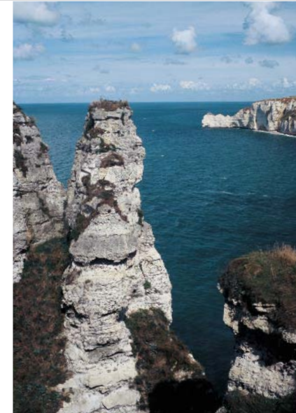
Nur Meer und Fels: die Falaises d'Aval.

Dort gehen wir an einer Kreuzung geradeaus in Richtung des Leuchturms am Cap d'Antifer (ein Abstecher, der sich nicht lohnt!), bis rechts ein gelb markierter Weg in das kleine Tal von Le Fourquet abzweigt. Nach einem Gefälle wandern wir kurz vor dem Meer über einen grasigen Hang steil bergauf an der Pointe du Fourquet vorbei zum Kalkplateau. Der gesamte Sentier du Littoral verläuft teilweise sehr nah am Steilabbruch der Klippen mit kräftigen An- und Abstiegen: Hier sollten Sie unbedingt trittsicher und etwas schwindelfrei sein! Mit herrlichen Tiefblicken auf das Meer folgen wir zunächst in leichtem Bergab und Bergauf der faszinierenden Steilküste, bis der Weg mit starkem Gefälle hinab in die unter Naturschutz stehende Valleuse d'Antifer mit ihrer seltenen Flora (z.B. blaue Hyazinthen) und Fauna (vor allem zahlreiche Vogelarten) führt. Hier sollten wir links einen kurzen Abstecher zum Strand machen, denn an dieser Stelle ist der Blick auf die fast 90 m hohen Kreidefelsen und das tiefblaue Meer besonders eindrucksvoll.