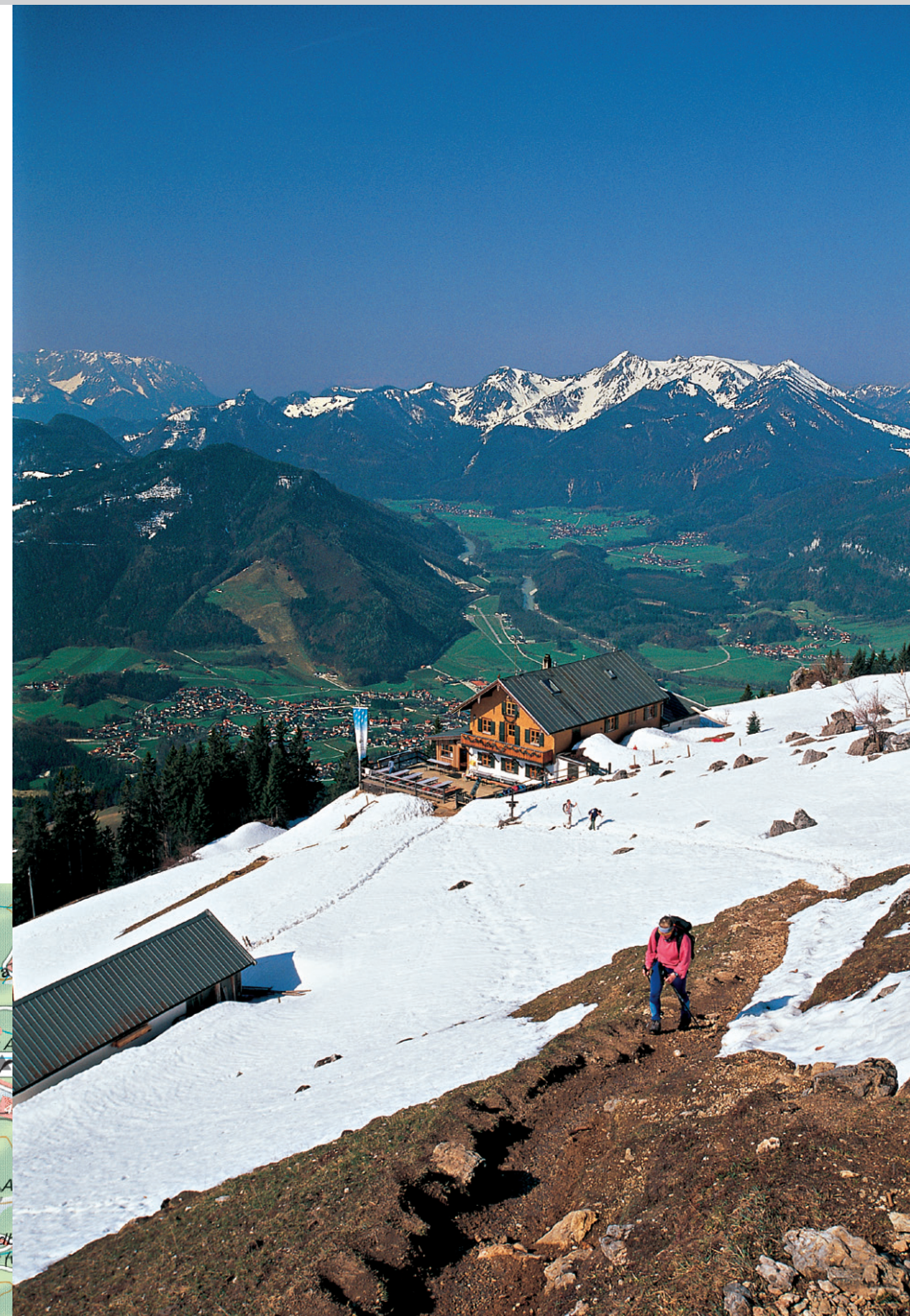
Schon früh im Jahr beliebtes Wanderziel: das Hochgernhaus.

weit ausholend in flachen Serpentinauf. An zwei Verzweigungen hält man sich das erste Mal links, das zweite Mal rechts (jeweils beschildert). So erreichen wir die Agergschwendt-Alm (1040 m). Der Weg führt von hier links am Almgebäude vorbei zum nahen Waldrand. Nun folgt ein langer Aufstieg durch den Wald, an einer unbeschilderten Abzweigung hält man sich geradeaus. Im letzten Teilstück leitet der Weg in vielen Serpentinaufstiegen zur Bergwachthütte (ca. 1300 m) und zum freien Almgelände. Linker Hand liegt hier die Enzi anhütte , nach wenigen Minuten kommt man zum Hochgernhaus (1461 m). Der Abstieg hält sich an den Aufstiegswegen.