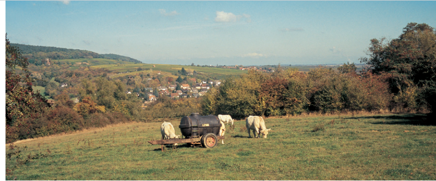
Idylle rurale à la périphérie de Wissembourg.

Par un sentier plaisant montant tout au plus de façon modérée, on arrive à la « Redoute 1708 » (modestes vestiges de la guerre), on traverse le grand fossé pour arriver enfin au sommet du Scherhol , 506 m (40 mn). Hélas, aucun panorama ne nous attend ici, la tour d'observation de 14 m de haut qui avait été édifée en 1895 par le C. V. a été détruite en 1940. Quelques pas avant le Refuge du Scherhol (abri), construit en 1903, nous descendons à droite par un sentier à flanc menant rapidement au Col du Pigeonnier , 432 m, et au refuge du Club Vosgien où on rejoint la D 3.