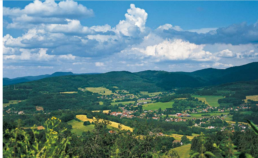
Weit blicken wir über den Talkessel von Ban-de-Laveline.