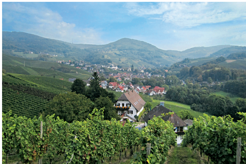
Blick auf Sasbachwalden vom Schelberg aus.

Bald jedoch steigt unser Weg im Rebgebiet noch einmal links bergan und trifft im Zickzackkurs zum Wasserspeicher des Murbergs , 363 m. Hier wenden wir uns talwärts zu einer großen Wohnanlage, anschließend erreichen wir im angrenzenden Wald ein Sträßchen, diesem folgen wir nun bis zur Kehre hinab und entscheiden uns beim Gaishöll-Einstieg (2) für den Waldpfad. Wenig später treffen wir auf den vom Anstieg bekannten Weg zum Ausgangspunkt (1) .