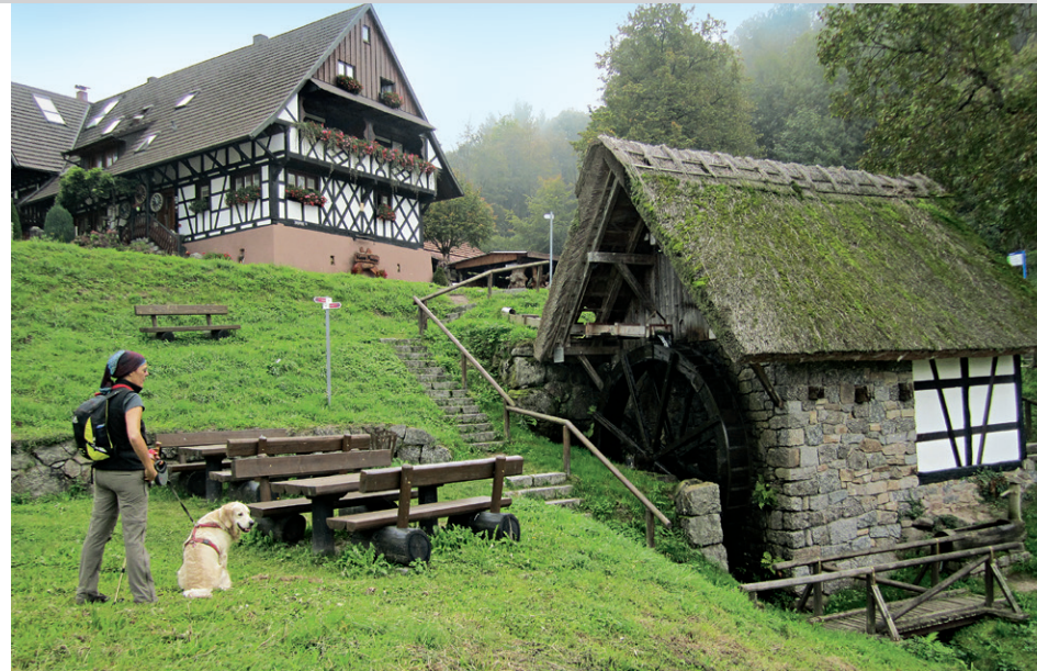
Rastbank bei der Straubenhöfmühle.

Vom Kurhaus »Zum Alde Gott« (1), 265 m in Sasbachwalden gehen wir durch den Kurgarten und biegen nach dem Freibad rechts ab. Wenig später steigt unser Weg neben dem Weinberg links bergan und führt uns anschließend durchs Rebanbaugelände, wobei wir den ungehinderten Talblick auf Sasbachwalden genießen. Im angrenzenden Wald halten wir uns erst rechts und wenig später links zur unteren Gaishöll (2), 350 m. Vom sprudelnden Brandbach begleitet, wandern wir durch die imposante Schlucht, die vor allem durch zahlreiche Holzbrücken und moosgrüne Felsbrocken geprägt ist. Bei der oberen Gaishöll, 493 m, verlassen wir den Wild-