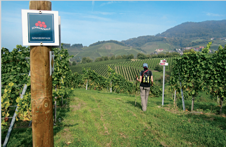
Beim Grieseneck führt der Genießerpfad durch die Reben.

Grasweg zu den schmucken Häusern hinauf in den Wald. Danach wenden wir uns vor den nächsten Gebäuden links und gelangen zu einer schön gelegenen Streuobstwiese. Bei der Marienstatue am Waldeck halten wir uns anschließend rechts und genießen den Panoramablick, während wir der Pfadspur folgen.