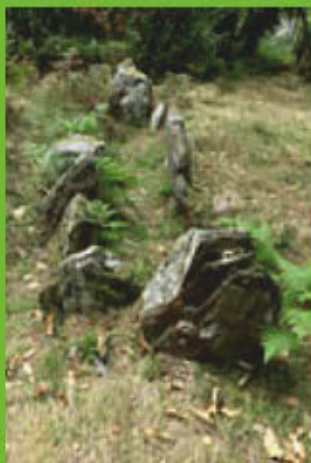
Le Courtils des Fées.

Le site mégalithique est caché dans les fourrés en sous-bois sur le haut de la colline. Cette allée couverte est divisée en deux chambres, l'une de 7 mètres de longueur, l'autre de 2 mètres. Les dalles qui les recouvraient ont disparu. Des fouilles effectuées dans les années 1980 ont permis de découvrir des ossements, dont les origines restent mystérieuses. La légende prétend qu'il s'agit de la demeure de fées qui avaient la réputation d'être des voleuses d'enfants !