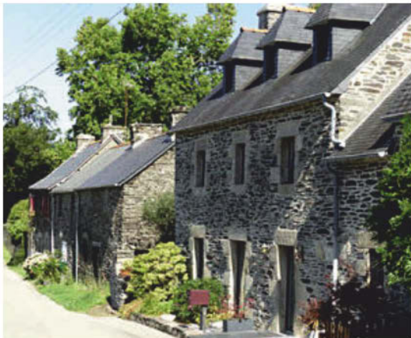
Le Vieux Bourg.