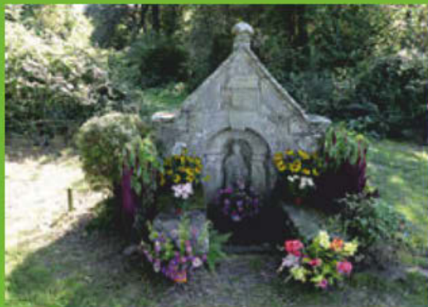
La fontaine Saint-Bertin.

Saint Bertin naquit dans la Manche au VII e siècle. Devenu moine, il dirigea le monastère de Sithiu à Saint-Omer. Saint Bertin est le patron de la paroisse de Guillac. Outre l'église, une fontaine lui est consacrée. Cette fontaine située à proximité du canal serait un ancien lieu de culte païen consacré par des moines évangélistes. Les paroissiens y viennent en procession lors de la fête de Saint-Bertin début septembre.