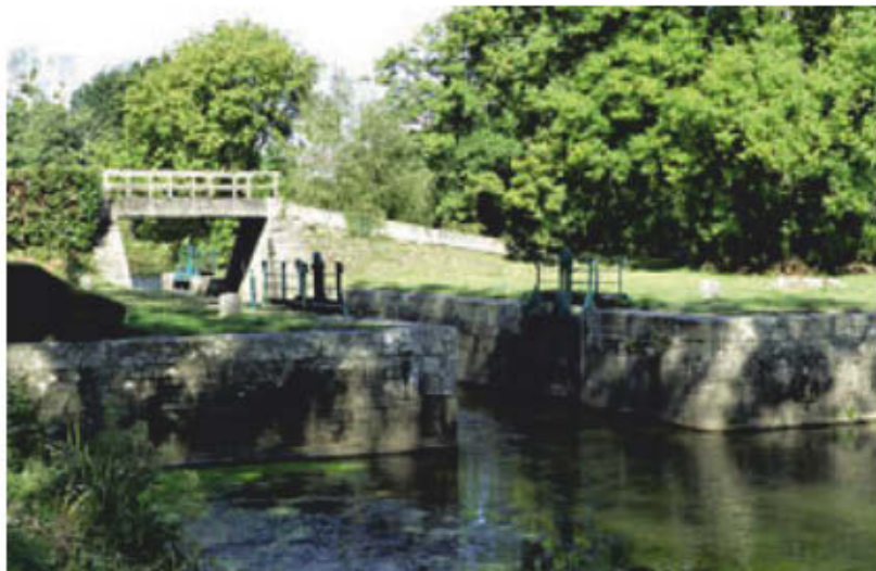
L'écluse de Limur.

le chemin de halage à gauche. À la croisée de chemins (point 2), montez le chemin creux qui part légèrement sur la gauche. À l'intersection, continuez à gauche et à la route, poursuivez à droite.