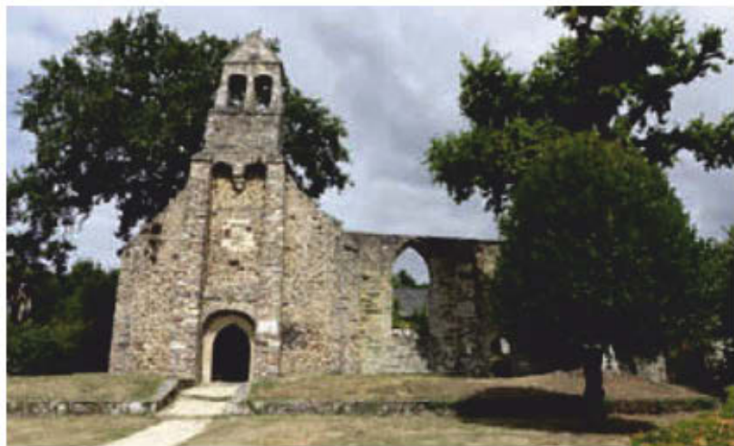
La chapelle de la Madeleine.

② Passez le pont pour rejoindre l'île Notre-Dame. Vous découvrez le moulin – qui n'est plus en activité –, l'église et le couvent des Augustins. Poursuivez jusqu'à la D764 que vous remontez jusqu'à la chapelle