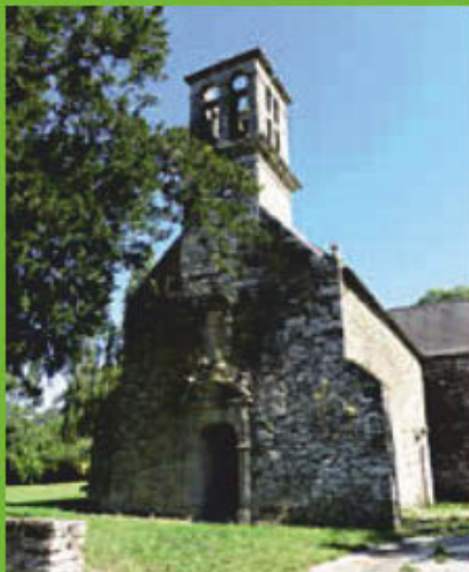
L'église Saint-They au Vieux Bourg.

Comme son nom l'indique, le chef-lieu de la commune était situé jusqu'en 1846 dans ce charmant petit hameau des bords de l'Aulne. On y découvre quelques jolies maisons anciennes et, au centre du village, l'église Saint-They à l'ombre de son if. L'église, édifiée au XVII e siècle, a la particularité de présenter un clocher démuné de flèche. Elle abrite une sculpture du XVI e siècle en bois polychrome représentant sainte Anne, la Vierge et l'Enfant. Il existait autrefois un bac à proximité du village qui permettait de traverser l'Aulne pour rejoindre Pleyben. Au retour d'une cérémonie religieuse au Vieux Bourg en 1693, le bac chavira, faisant soixante et une victimes.