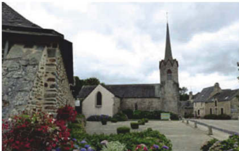
Le centre-bourg de Saint-Laurent.