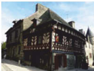
Au cœur de Josselin.

3 À la sortie, remontez la rue à droite. À 50 mètres, poursuivez à gauche rue de la Chapelle. Au bout, virez à gauche puis à droite pour rejoindre la rue du Général-de-Gaulle. Reprenez le pont sur la gauche puis longez le canal au pied du château pour rejoindre le parking.