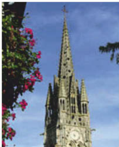
La basilique Notre-Dame du Roncier.