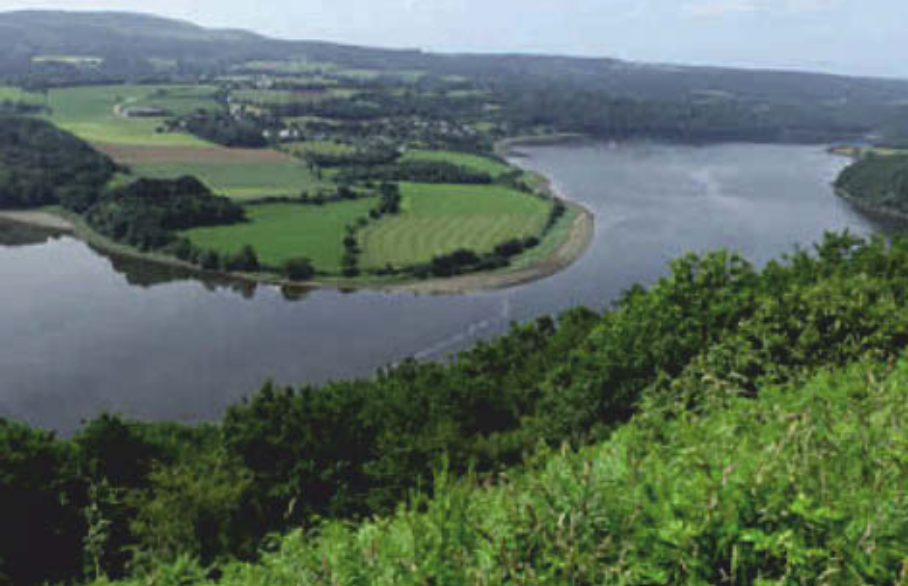
Méandre de l'Aulne.