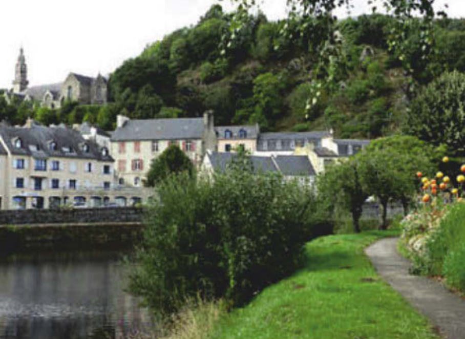
Le halage à Châteaulin.