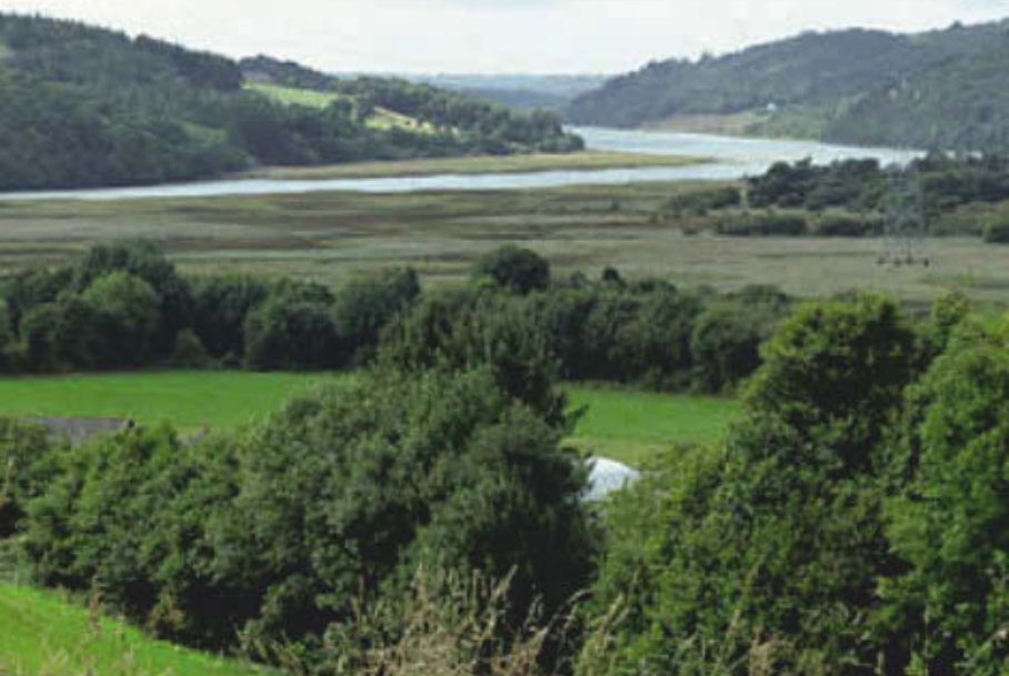
Vue sur un méandre de l'Aulne à Dinéault.