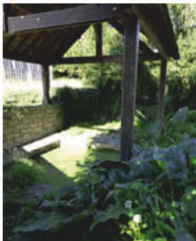
Le lavoir du parc des Coteaux.

maisons, descendez l'allée caillouteuse à gauche. Vous passez près de la fontaine Saint-Bertin. Suivez ensuite le halage sur votre gauche vers le parking de l'écluse.