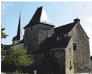
Logis accueillant la médiathèque à Peillac.

4 Avant les maisons, descendez à droite, traversez la D14. Prenez en face, passez la barrière et montez le chemin. Vous retrouvez l'itinéraire « aller » que vous prenez à gauche en sens inverse.