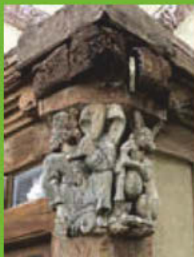
La maison de la Truie qui file.

Au centre de la cité, la place du Bouffay et les rues adjacentes recèlent une importante partie du riche patrimoine de Malestroit. On y remarque les nombreuses maisons en pan de bois du xv e et xvi e siècle avec leurs étonnantes et souvent drôles figurines sculptées : la truie qui file, le lièvre jouant du biniou... Il faut prendre un peu de recul pour apprécier les différents détails architecturaux de l'imposante église Saint-Gilles (x e et xvi e siècles). Rue du Général-de-Gaulle, on découvre quelques belles façades de maisons de type Renaissance. En s'éloignant du centre-ville, le monastère des Augustines d'un côté et les vestiges de la chapelle de la Madeleine de l'autre complètent cet impressionnant trésor patrimonial.