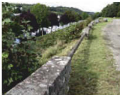
L'ancienne voie ferrée dominant le canal.

1 À la dernière maison, avant la descente, montez le sentier à droite. Vous rejoignez une petite route, montez à droite. Vous traversez une ferme, poursuivez tout droit par le chemin empierré. Au bout du chemin, traversez prudemment la D887 et continuez en face. Vous rejoignez le quartier de Ty Carré. Poursuivez tout droit. Vous atteignez la Grande Rue, descendez à droite.