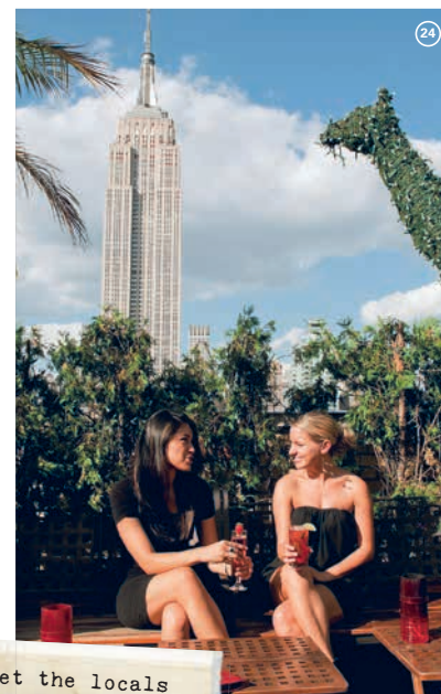
Meet the locals