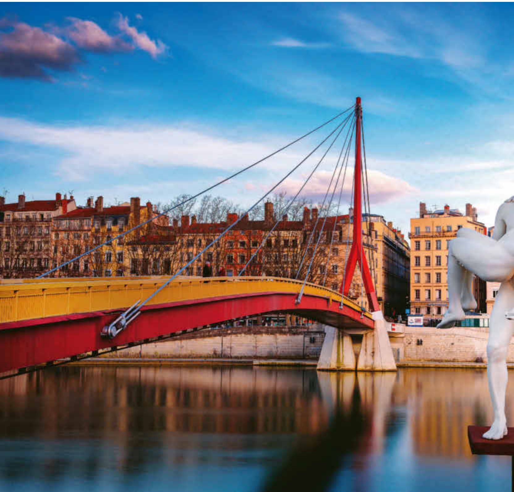
Statue « The Weight of Oneself » réalisée en poudre de marbre solidifié par le couple de sculpteurs scandinaves Elmgreen et Dragset. Face au Palais de Justice, la statue symbolise l'homme et son double, le poids de son fardeau et le désir de se sauver...