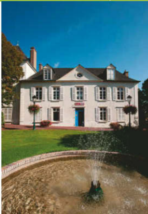
Le musée Louison-Bobet.

Office de Tourisme du Pays de Saint-Méen-le-Grand Tél. : 02 99 09 58 04 www.pays-stmeen-tourisme.fr