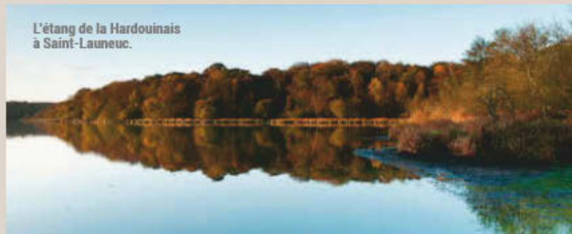
L'étang de la Hardouinais à Saint-Launeuc.

présente un écosystème diversifié pour la flore dont certaines espèces rares comme la glycérie aquatique, l'étoile d'eau, le jonc à feuilles variées colonisent l'étang. La faune ornithologique y est également riche. Nombre d'espèces migratrices hivernent sur le site : grèbes, cygnes, canards, foulques... on peut y voir aussi le martin-pêcheur et le faucon hobereau.