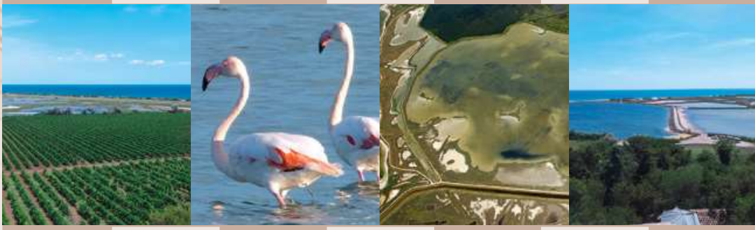
VIGNES DE MAGUELONE / PHOTO ADT34 ; FLAMANTS ROSES / PHOTO COMITÉ 34 ; SALINES DE VILLENEUVE / PHOTO SIEL ; VUE DE MAGUELONE / PHOTO ADT34

À un quart d'heure de Montpellier apparaît la mer. On en connaît bien sûr les longues plages qui se succèdent de la Grande Motte à Villeneuve-lès-Maguelone, propices à de longues balades tranquilles sous le soleil d'hiver. Mais à quelques encablures des stations balnéaires s'épanouit un autre monde, plus discret, plus sauvage aussi, celui des étangs montpellierains où se marient eaux douces et eaux salées. Ces milliers d'hectares de lagunes, exempts de toute urbanisation, en grande partie propriété du Conservatoire du Littoral et donc définitivement protégés, abritent une exceptionnelle richesse écologique labellisée d'importance internationale. Outre les nombreuses colonies de flamants roses et d'oiseaux migrateurs, on surprendra lors des balades dans les salins ou aux Aresquiers la fine échasse blanche, la délicate cigogne, ou la discrète et rare cistude d'Europe, cette petite tortue nichée dans les marais.