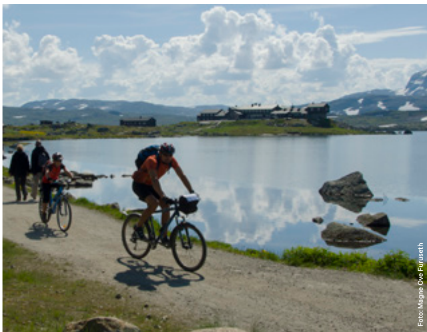
Steinlagt sti på Prestholtrunden.