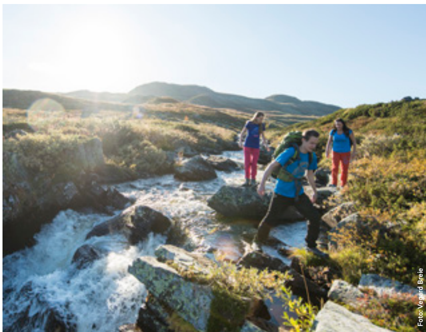
Hallingskarvet ruver over vidda.