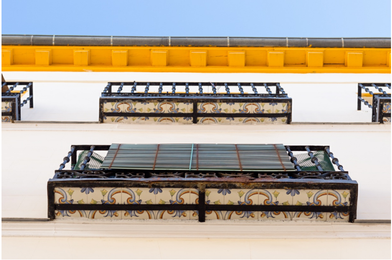
Een kijkje op de hemel van Madrid

'De Madrid al cielo' betekent 'Van Madrid naar de hemel'. Soms wordt dit gezegde uitgebreid met 'en vanuit de hemel een gaatje om ernaar te kijken'. Het komt erop neer dat er niets beters is dan Madrid. Hoewel het een miljoenenstad is waarin diverse culturen samenleven, zijn er ook buurten met een dorps karakter waar de sociale controle groot is. In het centrum kun je juist opgaan in de mensenmassa en struinen over statige straten als Gran Vía en Calle Alcalá.