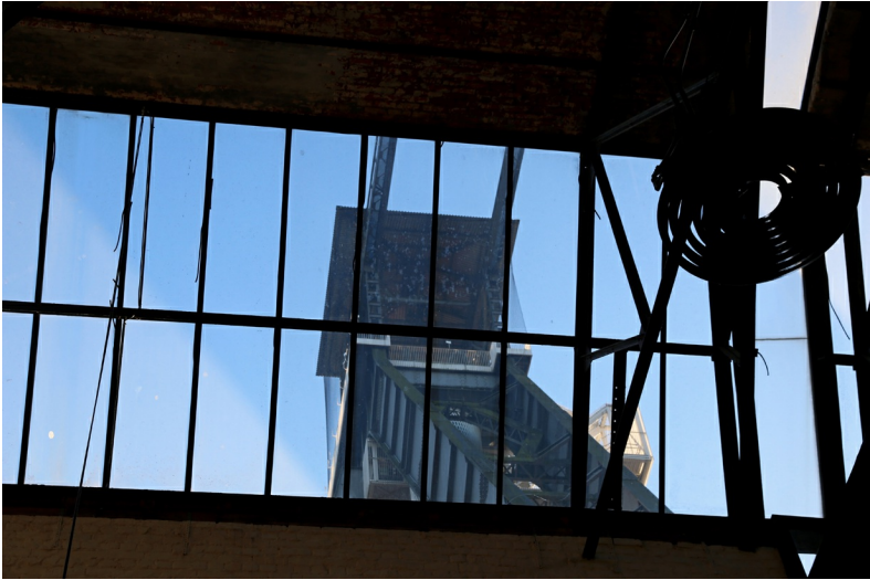
C-mine is een creatieve hotspot op uniek industrieel mijnrfogoed.

'Limburg' verwijst naar het vroegere hertogdom Limburg (12de-13de eeuw) dat de ruime omgeving van Eupen omvatte. Bestuurlijk centrum was het huidige plaatsje Limbourg. De naam Limburg dook terug op in 1815 toen het voormalige hertogdom bij het Verenigd Koninkrijk der Nederlanden gevoegd werd. De Nederlandse koning Willem I vond een bijkomende titel als 'hertog van Limburg' belangrijk voor zijn visitekaartje en hij vormde de nieuwe provincie Limburg. Een historische band met het vroegere hertogdom was er eigenlijk niet. Sinds 1839, bij de definitieve scheiding van Nederland en België, zijn er dus twee provincies Limburg.