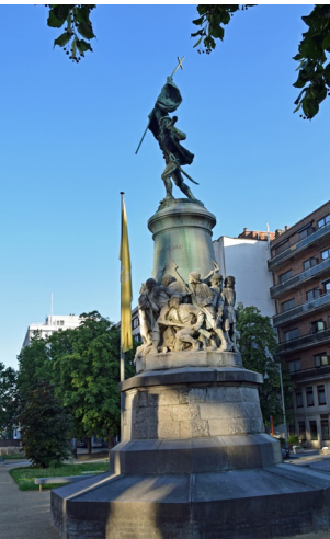
Monument Boerenkrijg in Hasselt

De eerste gekende graaf van Loon dook op in 1031. Zijn burcht in Borgloon was zijn machtscentrum. Zijn actieve nakomelingen breidden hun macht uit over het huidige Belgisch Limburg en aanpalende gebieden. Het overlijden van de kinderloze graaf Lodewijk IV in 1336 was het sein voor een machtsstrijd die dertig jaar later resulteerde in de opname van het graafschap Loon in het inmiddels machtige nabijgelegen prinsbisdom Luik.