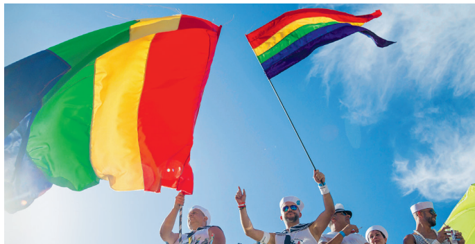
De regenboogkleuren van de vrijheid: Playa del Inglés is een bolwerk van de homoscene. Jaarlijks vindt hier in mei een grote Gay Pride Parade plaats