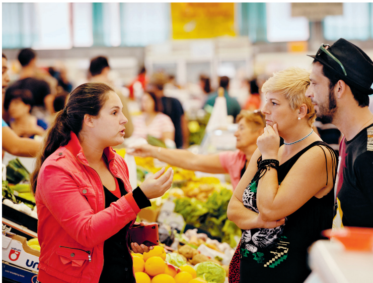
Ook in deze tijd van Facebook en andere sociale media is de markt van Vega de San Mateo nog altijd een belangrijke ontmoetingsplaats

orchidee-achtige calas (slangenwortels) die hier in overvloed groeien, ligt 2 km buiten San Mateo op een landgoed uit 1800. De negen knusse kamers zijn rond een kleine sinaasappelboomgaard gesitueerd. De andere gasten ontmoet je onder de pergola bij het zwembad, in de salon, in de muziekkamer of in het restaurant, waar je heerlijk kunt ontbijten en dineren. Omdat het hotel op een hoogte van zo'n 1000 m ligt, kan het in de winter koud worden (in de kamers is verwarming).