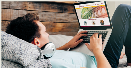
Op internet kun je alles vinden over accommodatie in Rome en ook online reserveren

Het antwoord op die vraag hangt natuurlijk ook af van hoeveel je kunt of wilt besteden. Maar los daarvan is de oer-Romeinse wijk Monti al jaren mijn favoriet. Je zit er niet ver van trein- en busstation en beide metrolijnen, op loopafstand van het stadscentrum uit de oudheid en ook dicht bij de beroemde pleinen in de oude stad. In de wijk zelf zitten veel leuke restaurantjes en aparte winkeltjes en het is er veel minder toeristisch dan je zou verwachten. Een andere fantastische buurt om te overnachten blijft natuurlijk Trastevere.