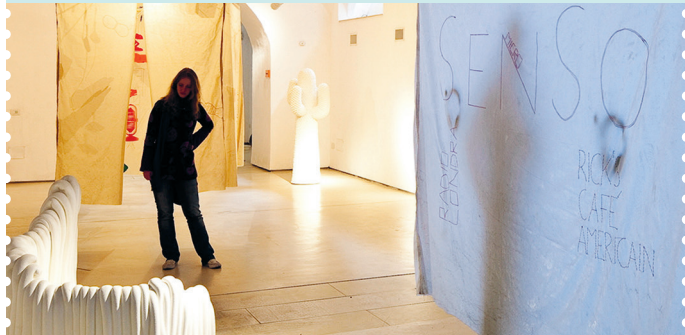
Plastic is ART: Plart is volledig gewijd aan deze 20e-eeuwse kunststof

Praktisch: toegang tot musea tot 60 tot 90 minuten voor sluitingstijd. Grote musea bieden audioguides, informatie over apps en tickets via de website, en hebben vaak een cafeteria en boekwinkel. In Capodimonte, San Martino en het MANN zijn sommige afdelingen alleen op bepaalde uren en dagen geopend. Ticketreservering (€1,50 tot €2 extra) op coopculture.it.