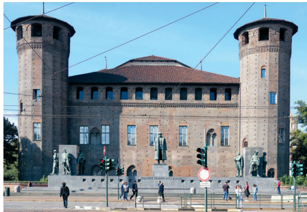
Middeleeuwse kant van Palazzo Madama

Sinds 1934 biedt Palazzo Madama onderdak aan het Museo Civico d'Arte Antica , met een grote collectie beeldhouwwerk, schilderijen en andere kunst van de middeleeuwen tot in de 19e eeuw, waaronder een van de belangrijkste collecties porselein wereldwijd. Achter de middeleeuwse torens is toen ook een middeleeuwse kruiden-