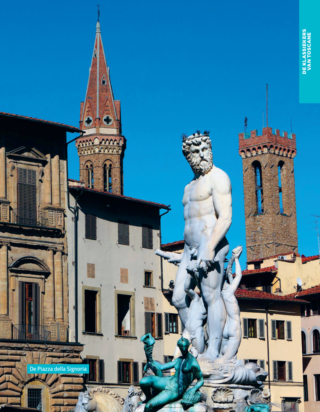
De Piazza della Signoria