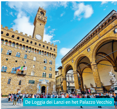
De Loggia dei Lanzi en het Palazzo Vecchio