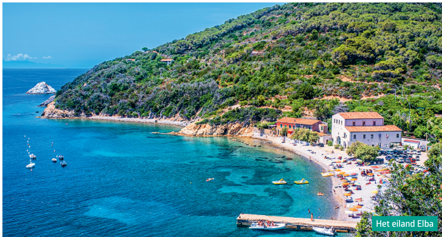
Het eiland Elba