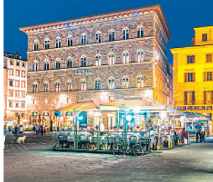
De Piazza della Signoria