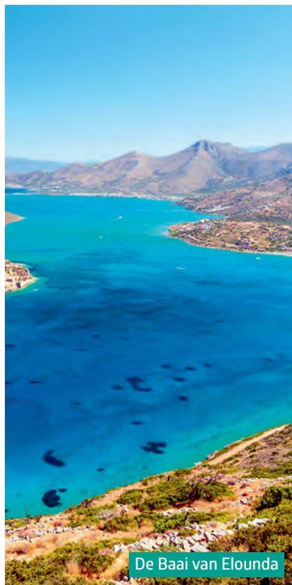
De Baai van Elounda