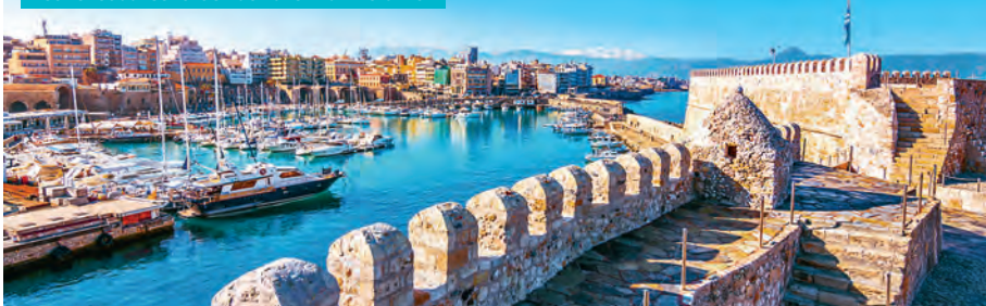
Het Venetiaanse fort en de haven van Heraklion

Auto: 20 minuten vanuit het centrum of 15 minuten vanaf de luchthaven.