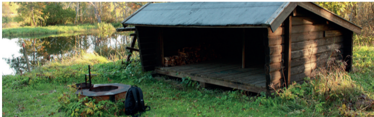
Vindskydd (shelter) i Västland.