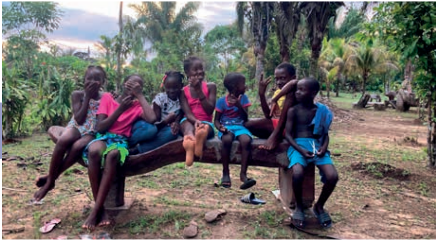
Kinderen na schooltijd.