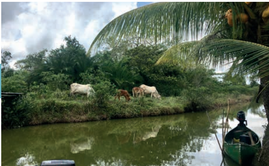
Buffels op Matapica.