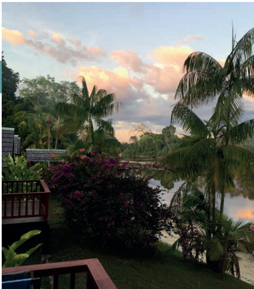
Danpaati River Resort.

vaste trek naar Paramaribo ontstaan. In de stad zit lang niet iedereen te wachten op binnenlandbewoners. Die beschikken doorgaans niet over diploma's, beheersen de Nederlandse taal nauwelijks en hebben bijna geen werkervaring.