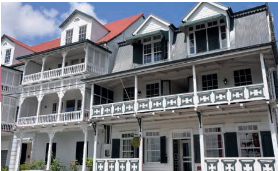
Gerestaureerde koloniale herenhuizen aan de Waterkant.

Tegenwoordig zijn aan de rand van de stad nog steeds ruime kavels te koop. Zeker in westelijke richting, ‘op’ Leiding, hebben bemiddelde Surinamers een fraai huis in een rustige, landelijke omgeving laten bouwen. Dezelfde ontwikkeling doet zich voor op Morgenstond in het noorden van de stad. Meer naar het zuiden, in de richting van het district Wanica, zijn landbouwgronden te vinden. Hier graast melk- en slachtvee zoals dat al vele generaties het geval is. Nogal wat stadsdelen zijn vernoemd naar de plantages die vroeger rond het fort lagen. Zo verwijzen de wijken Tourtonne en Maretraite in Paramaribo-Noord naar de tijd dat de Fransen het in Suriname voor het zeggen hadden. Ook bij de wijken Zorg en Hoop, Welgelegen en Geyersvljijt laat de herkomst zich raden.