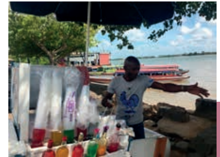
Schaafsijverkoper aan de Waterkant waar korjalen naar Meerzorg vertrekken.

Met Pieter Versterre, de volgende gouverneur, lag Combé ook geregeld in de clinch. Die bleek op grote schaal te hebben gezwendeld met plantages en nam het niet zo nauw met het afdragen van belastingen. Ondanks alle tegenwerking zag Combé na verloop van tijd kans de orde te herstellen. Pas na de afschaffing van de slavernij trok de Combéwijk ook andere bevolkingsgroepen aan. De gegoede burgerij verhuisde naar percelen verder buiten het centrum. Zo heeft de stad zich in de loop der eeuwen steeds verder uitgebreid. Omdat er bijna geen hoogbouw verrees en de meeste huizen werden omgeven door een erf, ontstond een uitgestrekt stedelijk gebied. Waar in vroeger tijden nog plantages waren, zijn inmiddels ruim opgezette woonwijken ontstaan. Een groot deel van de wijk Uitvlugt in Paramaribo-Zuid behoorde oorspronkelijk toe aan de plantersfamilies Graanoogst en Van Brussel. Tientallen straten, van de Rudie- en de Joanlaan tot de Henkielaan en de Gondastraat, verwijzen naar de vele nakomelingen van beide plantagehouders.