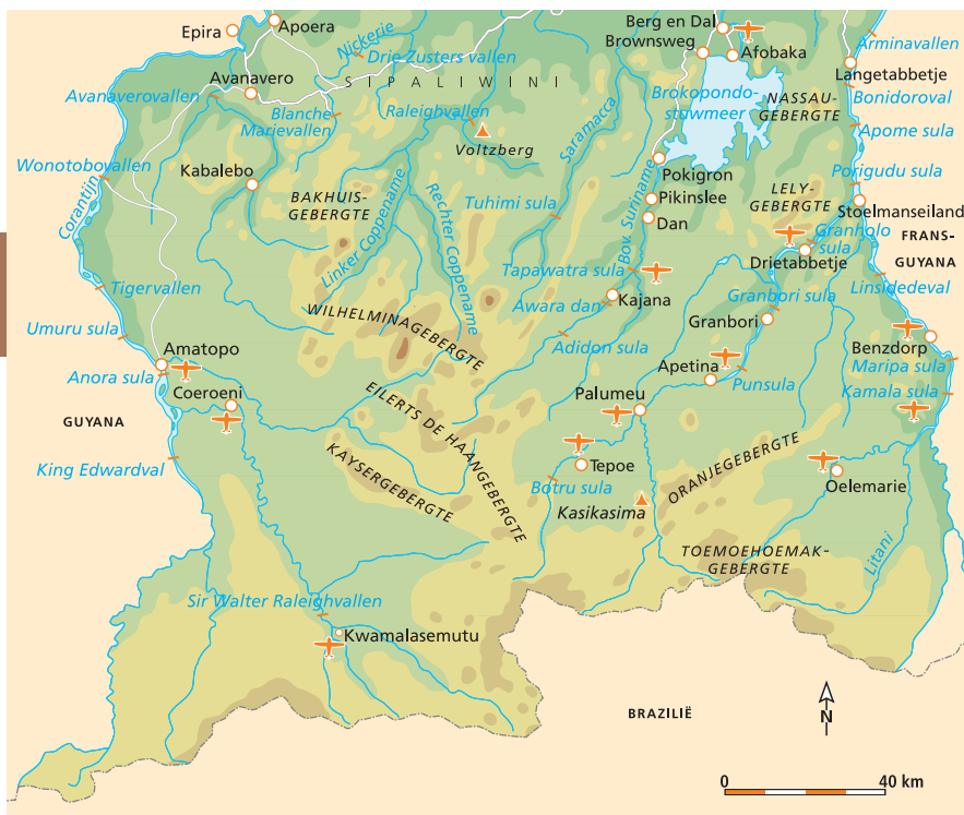
Het zuidelijke en grotendeels onherbergzame deel van Suriname