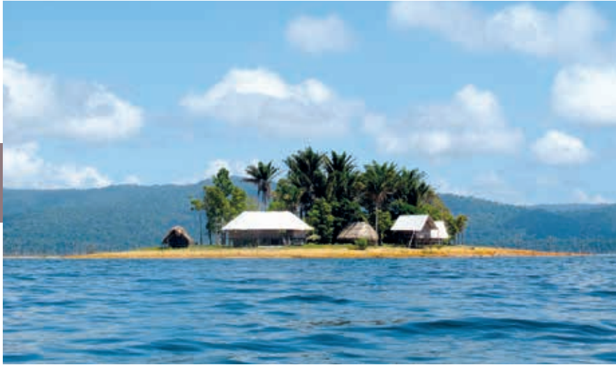
Stuwmeer ter grootte van provincie Utrecht.

bekend is hoeveel de vakantieganger dan in rekening wordt gebracht. Een andere bron van inkomsten is het kleurrijke houtsnijwerk dat hier wordt vervaardigd. De prijzen op Santigron liggen een stuk lager dan in de stad.