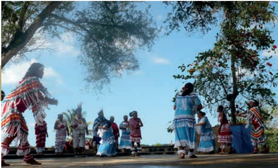
Rituele inheemse dans bij Fort Nieuw Amsterdam.