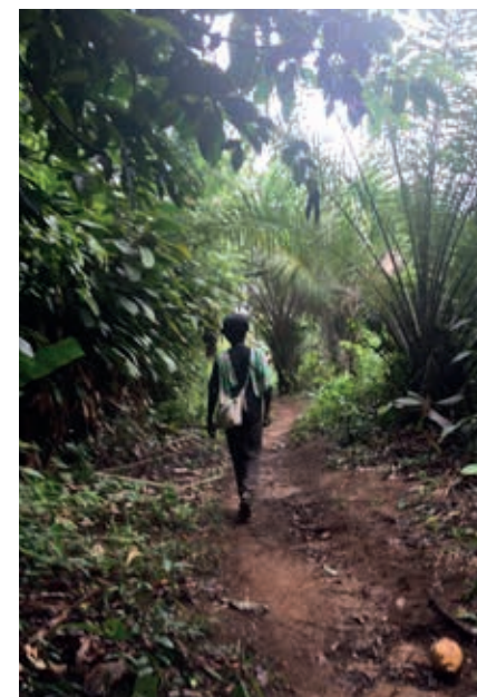
Vanuit het dorp naar een kostgrondje in het bos.

Meer voorbereiding vraagt de beklimming van het Kasikasimagebergte. De tocht naar de bergtoppen, vanuit Palumeu zo'n 70 km naar het zuiden, voert langs verschillende indrukwekkende sula's. Daar moeten passagiers