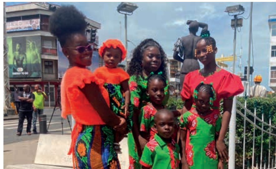
Famiri tijdens Keti Koti bij standbeeld Kwaku.

Want eigenlijk was het andersom: de UNESCO-vermelding betekende voor Suriname de morele verplichting om er zelf voor te zorgen dat de binnenstad