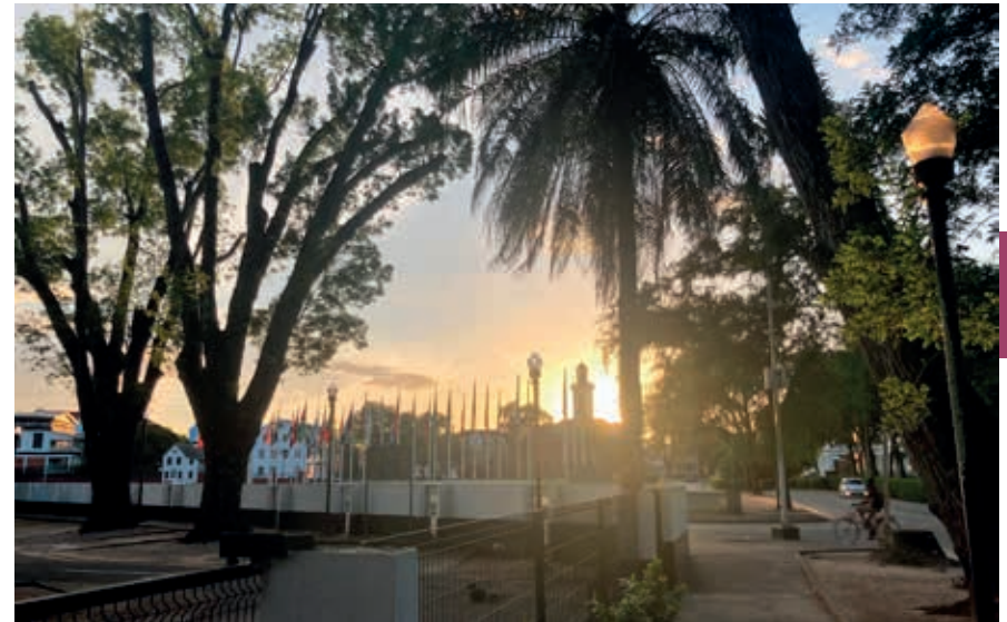
Het onafhankelijkheidsplein in Paramaribo tegen zonsondergang, gezien vanuit de Waterkant.

Ook een deel van de opbrengsten uit de houtexport komt ten goede aan de staatskas. Een ander exportproduct dat vooral wordt gewonnen in het oosten van Suriname, is palmolie. Vanaf 2015 kwamen signalen dat de economische ontwikkeling opnieuw stagneerde. Vlak na het begin van zijn