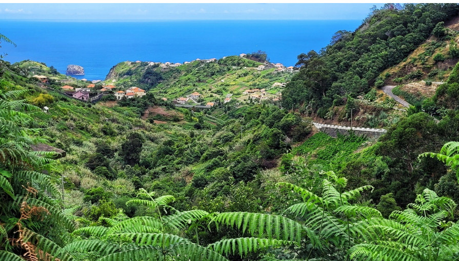
Het landschap van Noordoost-Madeira is overwegend groen

De Madeira-archipel is van vulkanische oorsprong en dat vertaalt zich in het uiterlijk van de eilanden. Diep onder de oceaan zijn miljoenen jaren geleden op de West-Afrikaanse tektonische plaat vulkanen omhooggestuwd die uiteindelijk boven de zeespiegel uitkwamen. Vervolgens begonnen wind en water aan hun schurende en slijpende erosiewerk van het basaltgesteente waaruit de bodem voor een belangrijk deel bestaat. Porto Santo is het oudste eiland; het is zo'n 10 miljoen jaar ouder dan Madeira. Madeira zelf is ook niet in één keer ontstaan. Op West-Madeira zijn veel jongere vulkanische formaties dan op Oost-Madeira.