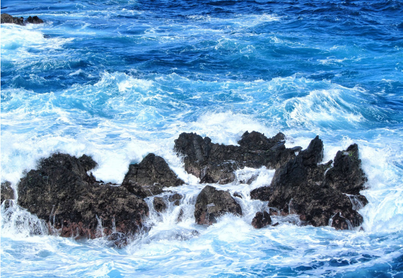
De Atlantische Oceaan beukt op de kust van Madeira

Op ongeveer duizend kilometer ten zuidwesten van Portugal, zevenhonderd kilometer ten westen van de Afrikaanse kust en bijna vierhonderd kilometer ten noorden van Tenerife liggen twee bewoonde eilanden die samen een autonome regio van Portugal zijn: Madeira en Porto Santo. Madeira is grillig, bergachtig en groen. Porto Santo heeft geen bergtoppen van betekenis en is kaler, maar bezit wel het mooiste strand. Op de eilanden samen wonen bijna 270.000 mensen. Vanwege het heerlijke milde klimaat (het hele jaar door), het landschappelijke spektakel (met de vele levada's en de uitgestrekte laurierbossen) en de uitbundige bloemenpracht is het toerisme al sinds de 19de eeuw de belangrijkste inkomstenbron.