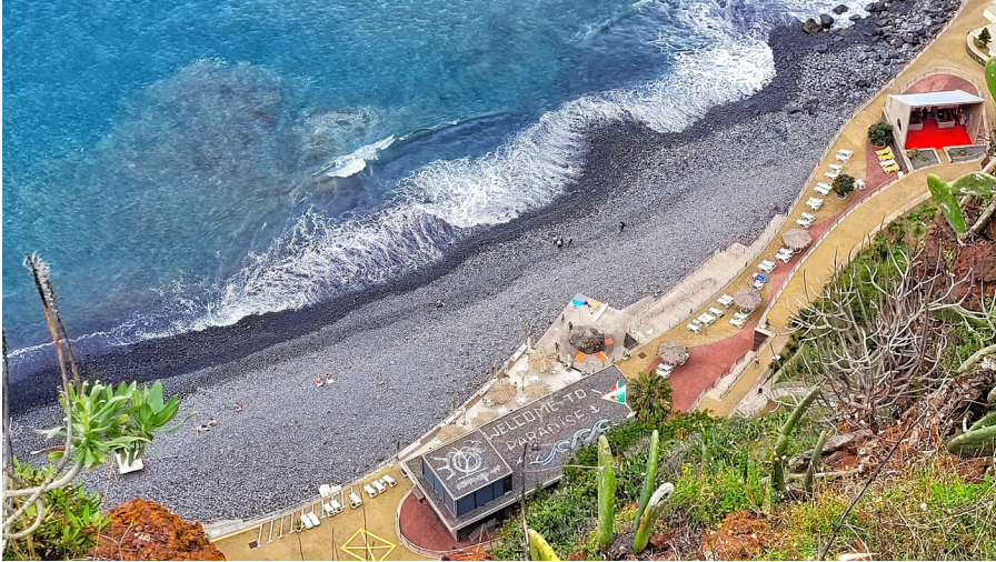
Madeira heeft geen natuurlijke witte stranden

De stranden op Madeira zijn smal en bestaan voor het overgrote deel uit keien, kiezels en soms wat zwart vulkanisch zand. Bij Calheta en Machico zijn wel kunstmatige stranden aangelegd met licht zand uit Marokko, maar verwacht geen Noordzeestrand, want ze zijn niet enorm groot. Wie op een wit strand wil liggen, moet naar Porto Santo. Aan de zuidzijde van dat eiland ligt wél een prachtig strand, bijna 8 kilometer lang en met lage zandduinen erachter. Daarentegen heeft Porto Santo geen hoge bergen of weelderige bossen. Het eiland is behoorlijk kaal, ook al zijn er herbebossingsprojecten gestart, en het hoogste punt is Pico do Facho (516 m).