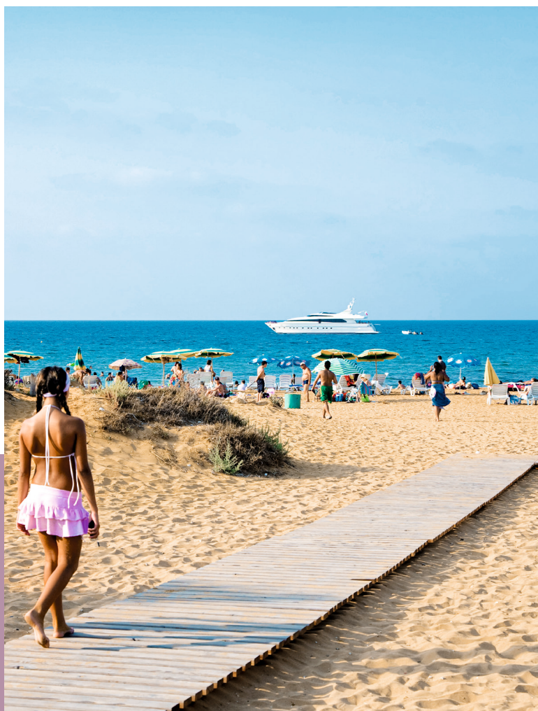
Strandleven à la Gozo: aan de Ramla Bay